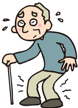
少し歩くとふくらはぎが痛くなり、少し休むと回復する