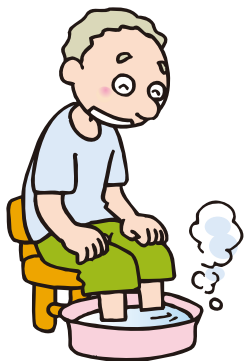
朝や寝る前の 足浴は欠かせない