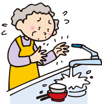
水道水が冷たくてさわれない