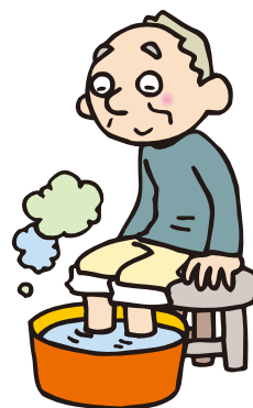
朝や寝る前の足浴が欠かせない