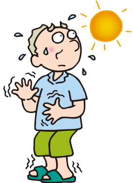
暑い日なのに 手足は冷たい