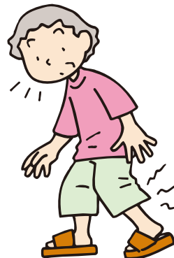
少し歩いただけで ふくらはぎに違和感がある