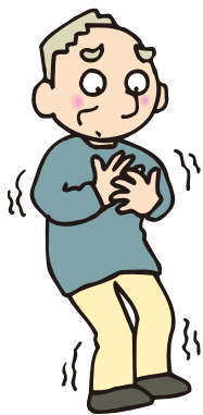
とくに、朝晩手足の冷えを強く感じる