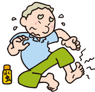
水虫やちょっとした傷が 治りにくい