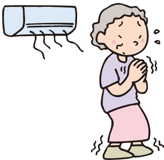
手足の冷えが辛いので 冷房は苦手