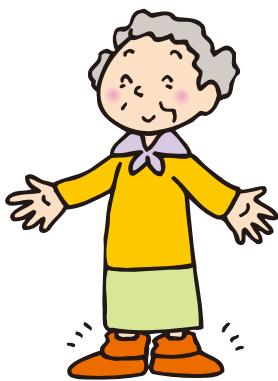
厚手の靴下が手放せない