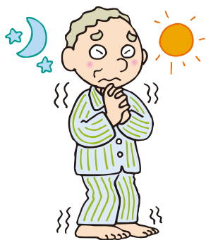
朝晩に手足の冷えを強く感じる