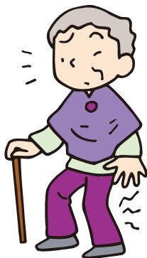
少し歩くとふくらはぎが痛くなり、少し休むと回復する