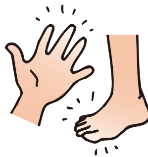
手足の色調変化がある（白っぽくなる）