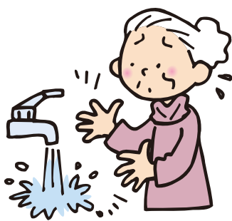
水道水が冷たくてさわれない