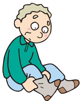
厚手の靴下が手放せない