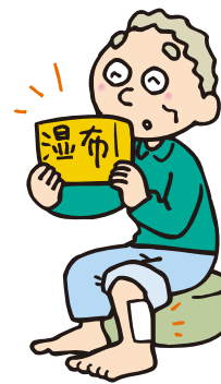
歩くと痛みが出るので、湿布が手放せない