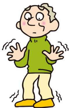
手足の冷えをより強く感じる