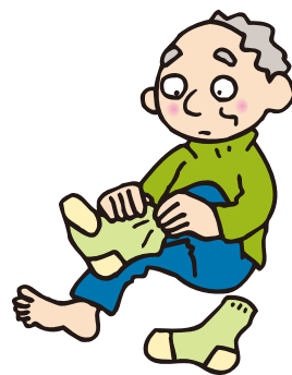
厚手の靴下が手放せない