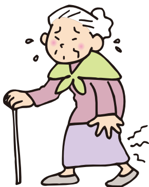
少ししか歩いていないのに足が痛くなる