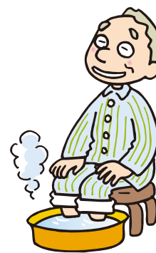
朝や寝る前の足浴が欠かせない