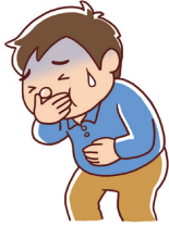
・下痢、嘔吐(おうと)

次の状態(シックデイ)のときには、脱水状態になることがありますので、メトホルミン塩酸塩錠MT「TE」をのむのをいったんやめて、医師または薬剤師に相談してください。また、 適度に水分をとる よう心がけてください。