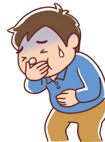
・下痢、嘔吐(おうと)

次の状態(シックデイ)のときには、脱水状態になることがありますので、メトホルミン塩酸塩錠MT「TE」をのむのをいったんやめて、医師または薬剤師に相談してください。また、 適度に水分をとる よう心がけてください。