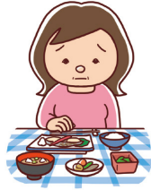
・食欲不振(食欲がなく 食事がとれない)