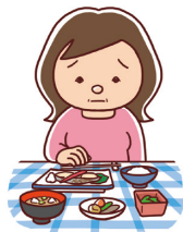
・食欲不振(食欲がなく 食事がとれない)